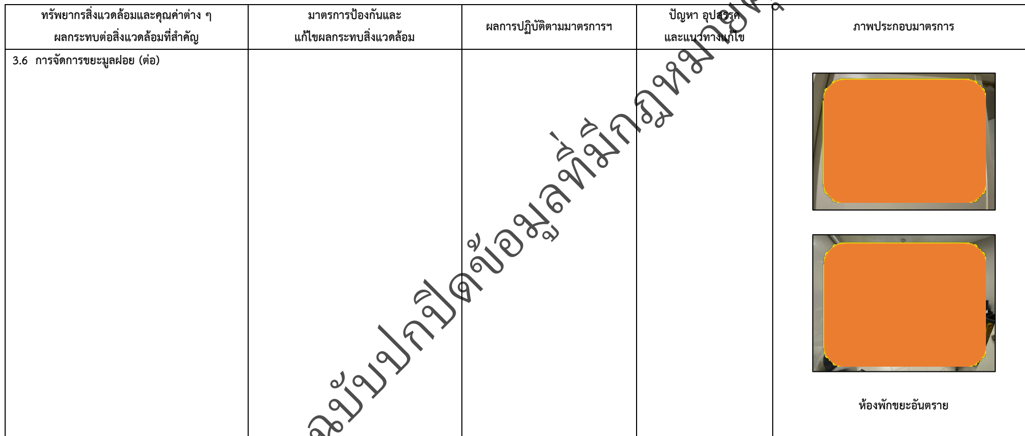
ตารางที่ 2-1 สรุปผลกระทบสิ่งแวดล้อมที่สำคัญและการปฏิบัติตามมาตรการป้องกันและแก้ไขผลกระทบสิ่งแวดล้อม มาตรการติดตามตรวจสอบผลกระทบสิ่งแวดล้อม โครงการโรงพยาบาลเกษมราษฎร์ รามคำแหง (ระยะดำเนินการ) (ต่อ)

โครงการ โรงพยาบาลเกษมราษฎร์ รามคำแหง (ระยะดำเนินการ) ของบริษัท บางกอกเจน ฮอสปิเทล จำกัด (มหาชน)