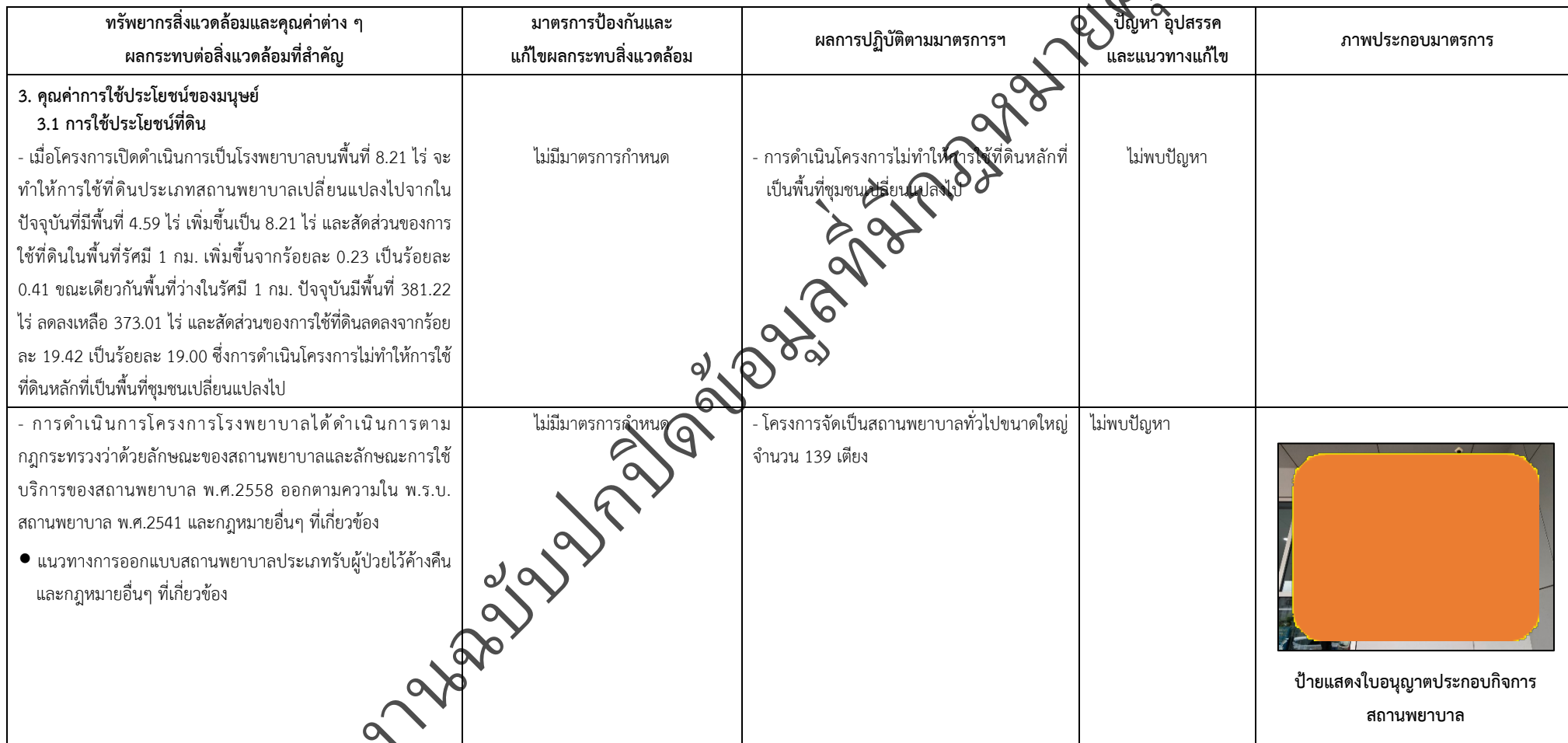
ตารางที่ 2-1 สรุปผลกระทบสิ่งแวดล้อมที่สำคัญและการปฏิบัติตามมาตรการป้องกันและแก้ไขผลกระทบสิ่งแวดล้อม มาตรการติดตามตรวจสอบผลกระทบสิ่งแวดล้อม โครงการโรงพยาบาลเกษมราษฎร์ รามคำแหง (ระยะดำเนินการ) (ต่อ)

โครงการ โรงพยาบาลเกษมราษฎร์ รามคำแหง (ระยะดำเนินการ) ของบริษัท บางกอกเจน ฮอสปิทอล จำกัด (มหาชน)