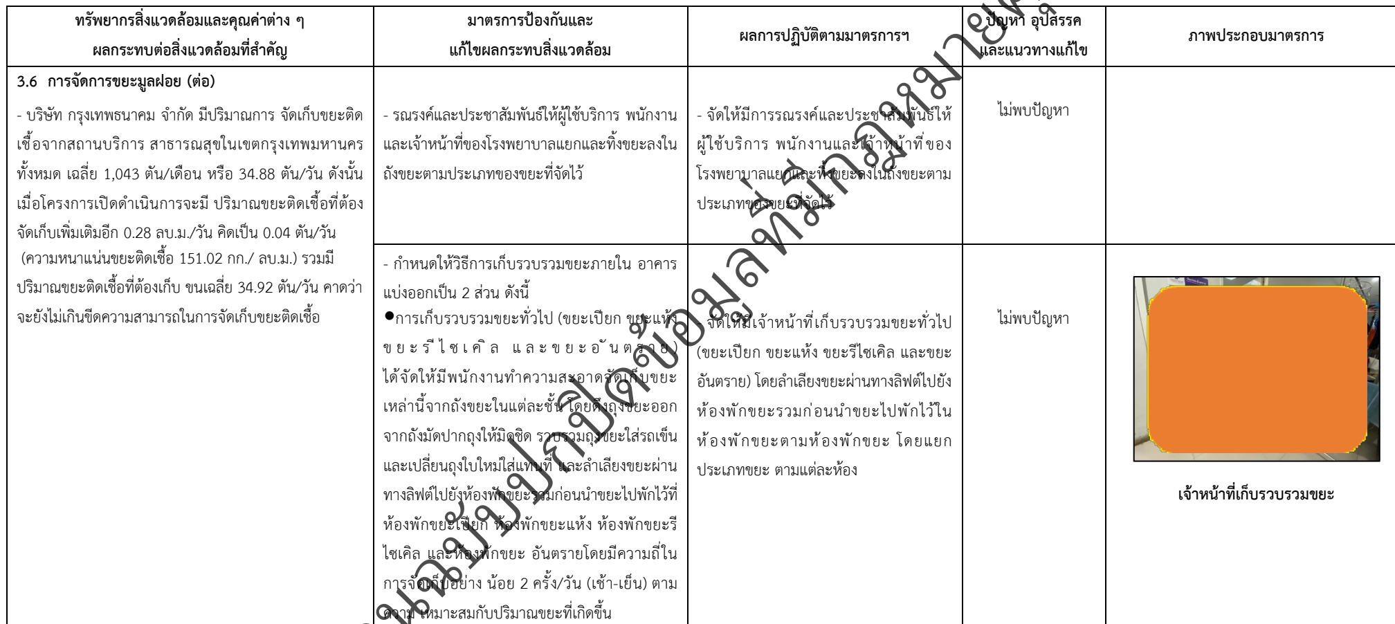
ตารางที่ 2-1 สรุปผลกระทบสิ่งแวดล้อมที่สำคัญและการปฏิบัติตามมาตรการป้องกันและแก้ไขผลกระทบสิ่งแวดล้อม มาตรการติดตามตรวจสอบผลกระทบสิ่งแวดล้อม โครงการโรงพยาบาลเกษมราษฎร์ งามคำแหง (ระยะดำเนินการ) (ต่อ)

โครงการ โรงพยาบาลเกษมราษฎร์ งามคำแหง (ระยะดำเนินการ) ของบริษัท บางกอกเจน ฮอสปิทอล จำกัด (มหาชน)