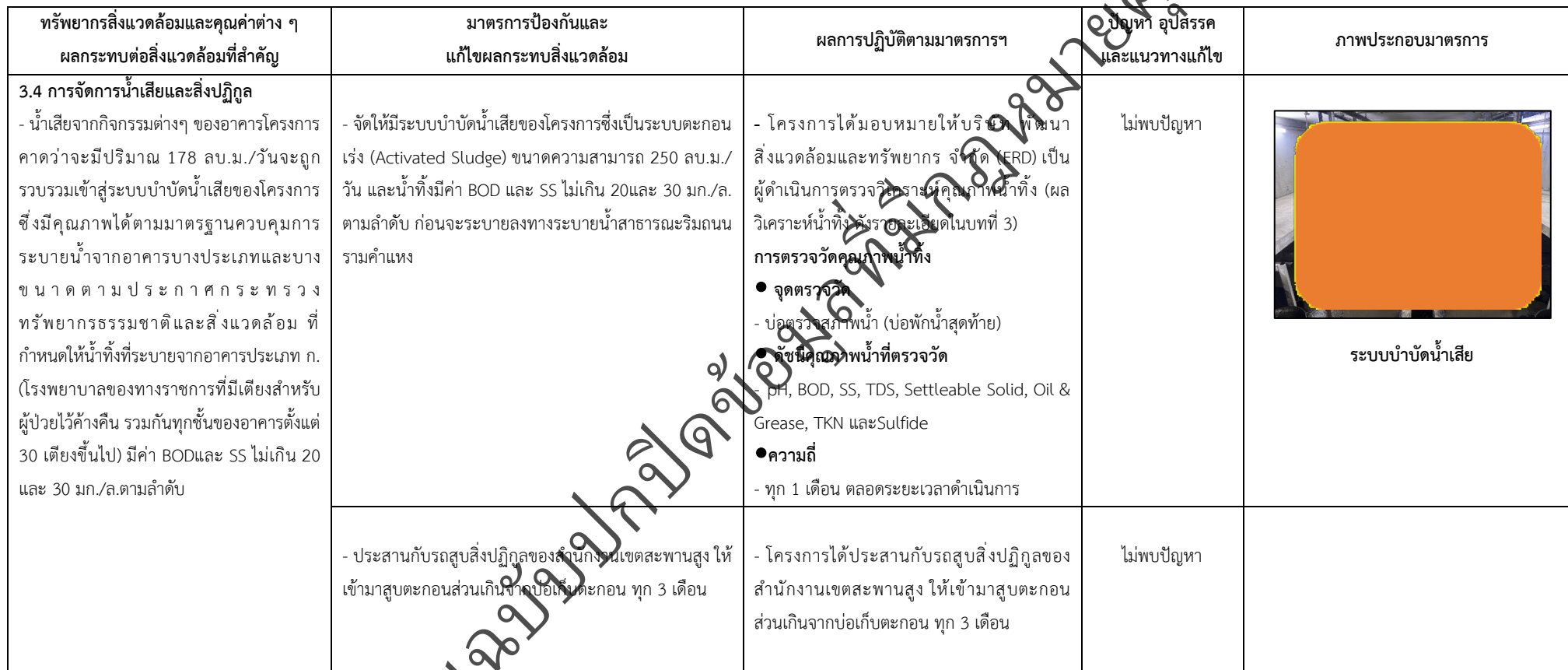
ตารางที่ 2-1 สรุปผลกระทบสิ่งแวดล้อมที่สำคัญและการปฏิบัติตามมาตรการป้องกันและแก้ไขผลกระทบสิ่งแวดล้อม มาตรการติดตามตรวจสอบผลกระทบสิ่งแวดล้อม โครงการโรงพยาบาลเกษมราษฎร์ รามคำแหง (ระยะดำเนินการ) (ต่อ)

โครงการ โรงพยาบาลเกษมราษฎร์ รามคำแหง (ระยะดำเนินการ) ของบริษัท บางกอกเจน ฮอสปิทอล จำกัด (มหาชน)