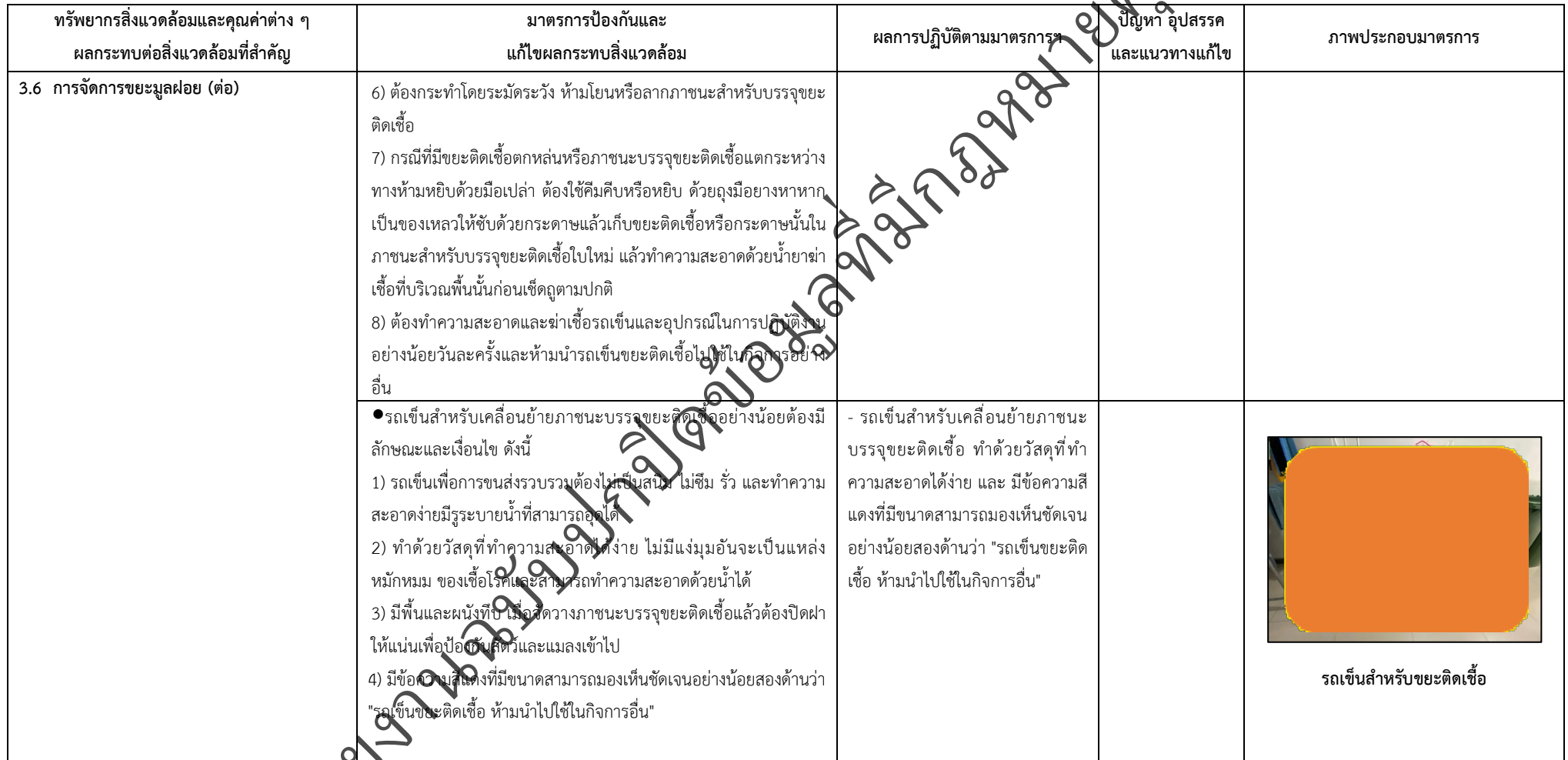
ตารางที่ 2-1 สรุปผลกระทบสิ่งแวดล้อมที่สำคัญและการปฏิบัติตามมาตรการป้องกันและแก้ไขผลกระทบสิ่งแวดล้อม มาตรการติดตามตรวจสอบผลกระทบสิ่งแวดล้อม โครงการโรงพยาบาลเกษมราษฎร์ รามคำแหง (ระยะดำเนินการ) (ต่อ)

โครงการ โรงพยาบาลเกษมราษฎร์ รามคำแหง (ระยะดำเนินการ) ของบริษัท บางกอกเจน ฮอสปิทอล จำกัด (มหาชน)