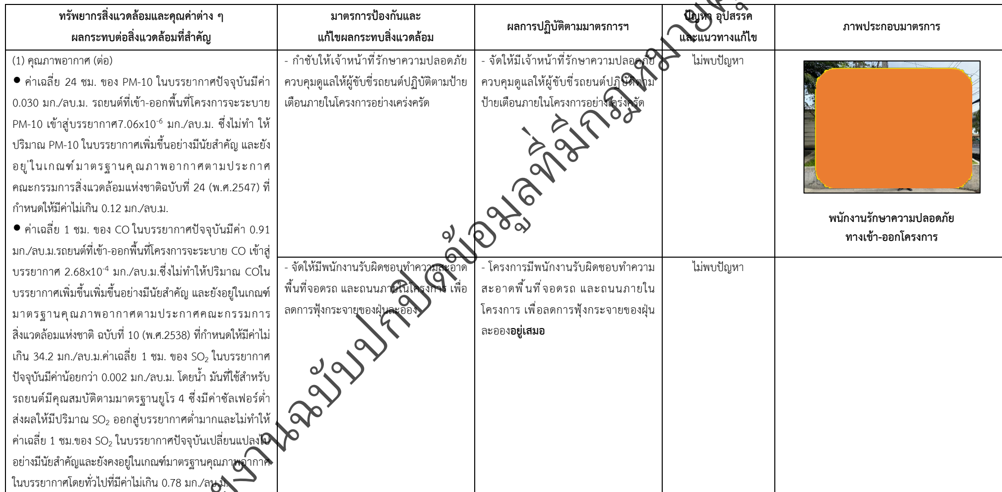
ตารางที่ 2-1 สรุปผลกระทบสิ่งแวดล้อมที่สำคัญและการปฏิบัติตามมาตรการป้องกันและแก้ไขผลกระทบสิ่งแวดล้อม มาตรการติดตามตรวจสอบผลกระทบสิ่งแวดล้อม โครงการโรงพยาบาลเกษมราษฎร์ रामคำแหง (ระยะดำเนินการ) (ต่อ)

โครงการ โรงพยาบาลเกษมราษฎร์ रामคำแหง (ระยะดำเนินการ) ของบริษัท บางกอกเจน ฮอสปิทอล จำกัด (มหาชน)