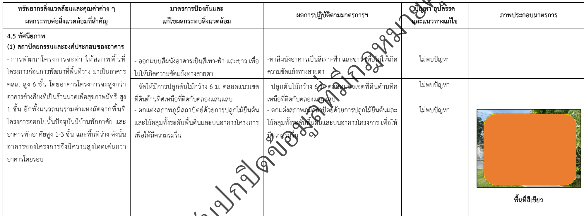
ตารางที่ 2-1 สรุปผลกระทบสิ่งแวดล้อมที่สำคัญและการปฏิบัติตามมาตรการป้องกันและแก้ไขผลกระทบสิ่งแวดล้อม มาตรการติดตามตรวจสอบผลกระทบสิ่งแวดล้อม โครงการโรงพยาบาลเกษมราษฎร์ รามคำแหง (ระยะดำเนินการ) (ต่อ)

โครงการ โรงพยาบาลเกษมราษฎร์ รามคำแหง (ระยะดำเนินการ) ของบริษัท บางกอกเจน ฮอสปิทอล จำกัด (มหาชน)