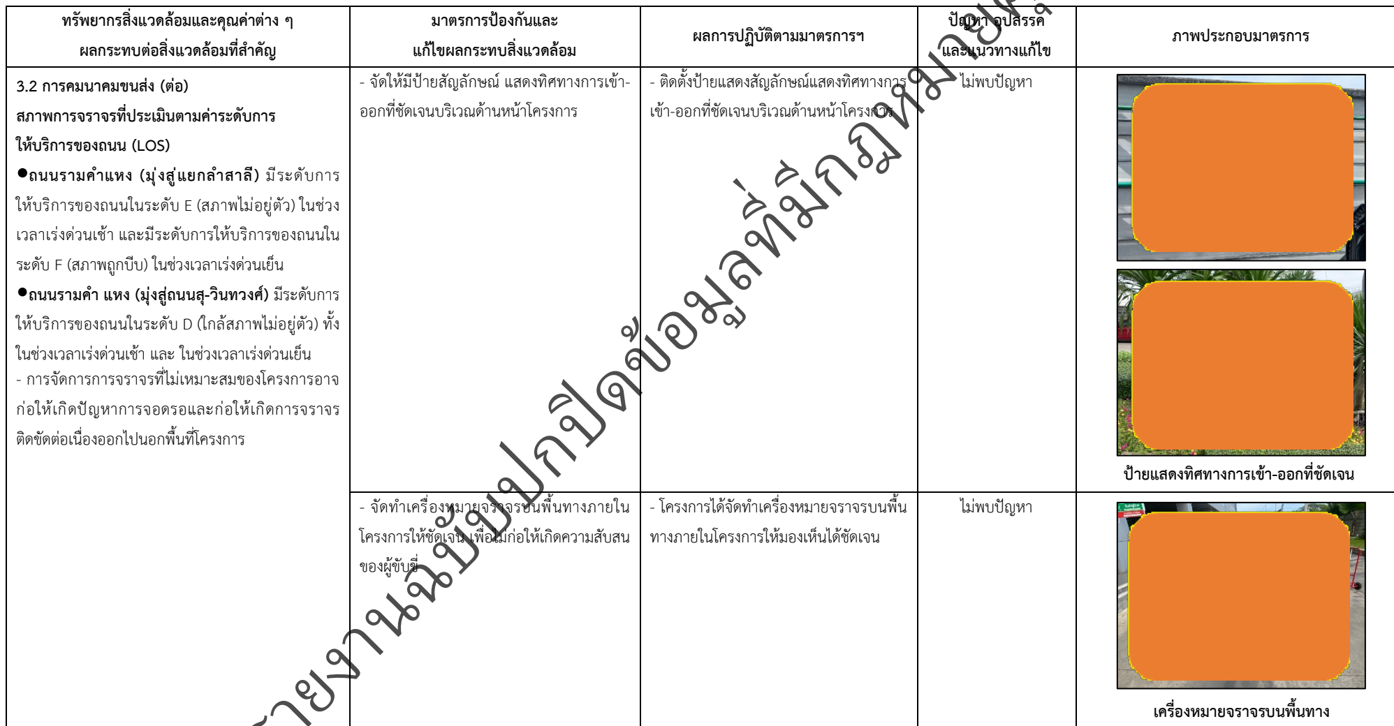
ตารางที่ 2-1 สรุปผลกระทบสิ่งแวดล้อมที่สำคัญและการปฏิบัติตามมาตรการป้องกันและแก้ไขผลกระทบสิ่งแวดล้อม มาตรการติดตามตรวจสอบผลกระทบสิ่งแวดล้อม โครงการโรงพยาบาลเกษมราษฎร์ งามคำแหง (ระยะดำเนินการ) (ต่อ)

โครงการ โรงพยาบาลเกษมราษฎร์ งามคำแหง (ระยะดำเนินการ) ของบริษัท บางกอกเจน ฮอสปิทอล จำกัด (มหาชน)