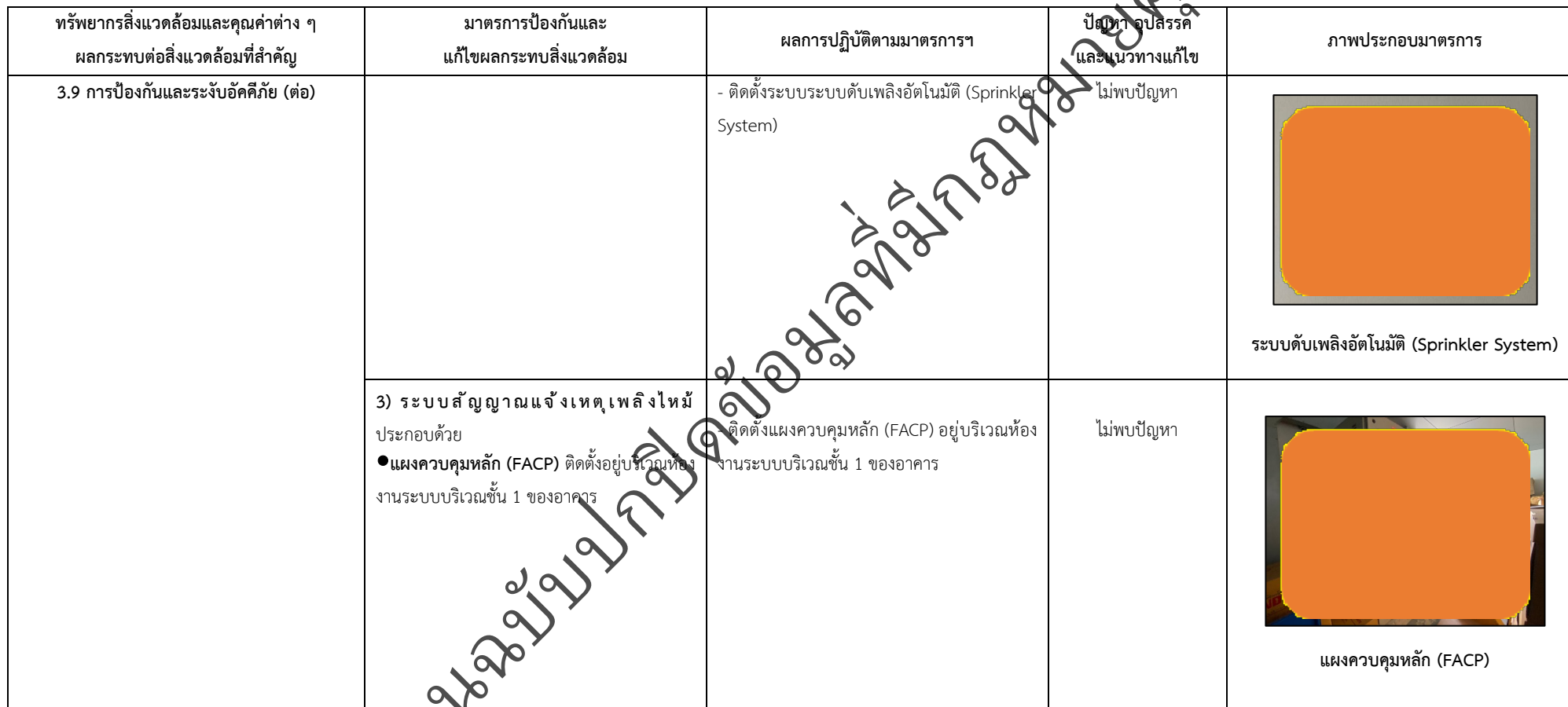
ตารางที่ 2-1 สรุปผลกระทบสิ่งแวดล้อมที่สำคัญและการปฏิบัติตามมาตรการป้องกันและแก้ไขผลกระทบสิ่งแวดล้อม มาตรการติดตามตรวจสอบผลกระทบสิ่งแวดล้อม โครงการโรงพยาบาลเกษมราษฎร์ งามคำแหง (ระยะดำเนินการ) (ต่อ)

โครงการ โรงพยาบาลเกษมราษฎร์ งามคำแหง (ระยะดำเนินการ) ของบริษัท บางกอกเจน ฮอสปิทอล จำกัด (มหาชน)