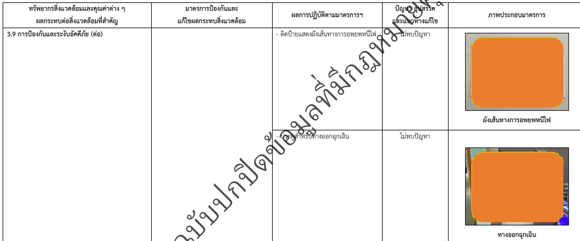
ตารางที่ 2-1 สรุปผลกระทบสิ่งแวดล้อมที่สำคัญและการปฏิบัติตามมาตรการป้องกันและแก้ไขผลกระทบสิ่งแวดล้อม มาตรการติดตามตรวจสอบผลกระทบสิ่งแวดล้อม โครงการโรงพยาบาลเกษมราษฎร์ งามคำแหง (ระยะดำเนินการ) (ต่อ)

โครงการ โรงพยาบาลเกษมราษฎร์ งามคำแหง (ระยะดำเนินการ) ของบริษัท บางกอกเจน ฮอสปิทอล จำกัด (มหาชน)