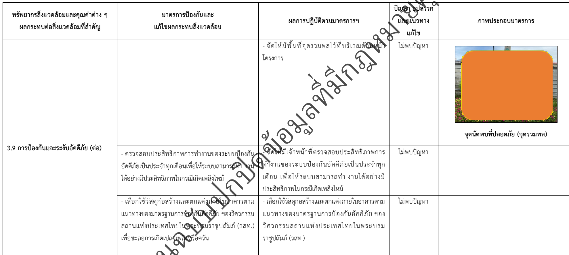
ตารางที่ 2-1 สรุปผลกระทบสิ่งแวดล้อมที่สำคัญและการปฏิบัติตามมาตรการป้องกันและแก้ไขผลกระทบสิ่งแวดล้อม มาตรการติดตามตรวจสอบผลกระทบสิ่งแวดล้อม โครงการโรงพยาบาลเกษมราษฎร์ รามคำแหง (ระยะดำเนินการ) (ต่อ)

โครงการ โรงพยาบาลเกษมราษฎร์ รามคำแหง (ระยะดำเนินการ) ของบริษัท บางกอกเจน ฮอสปิทอล จำกัด (มหาชน)