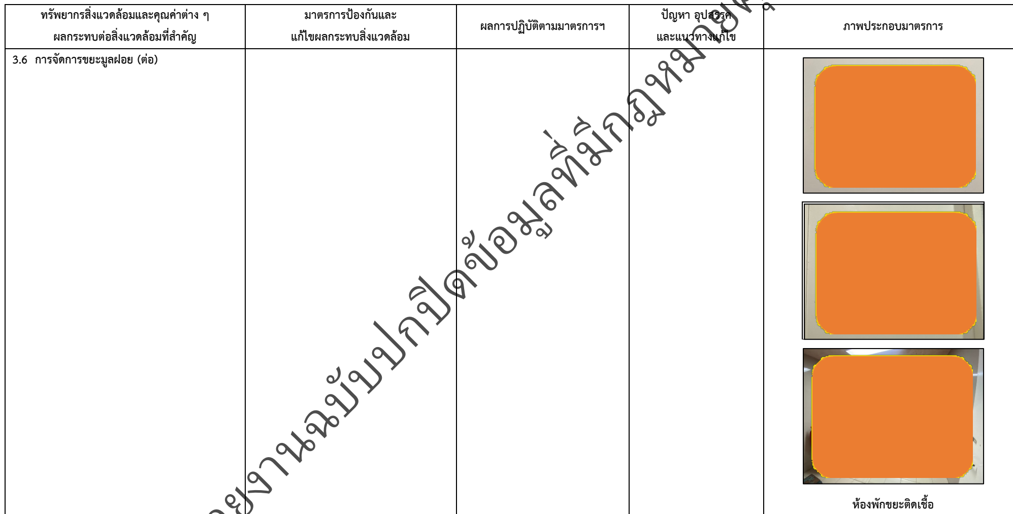
ตารางที่ 2-1 สรุปผลกระทบสิ่งแวดล้อมที่สำคัญและการปฏิบัติตามมาตรการป้องกันและแก้ไขผลกระทบสิ่งแวดล้อม มาตรการติดตามตรวจสอบผลกระทบสิ่งแวดล้อม โครงการโรงพยาบาลเกษมราษฎร์ รามคำแหง (ระยะดำเนินการ) (ต่อ)

โครงการ โรงพยาบาลเกษมราษฎร์ รามคำแหง (ระยะดำเนินการ) ของบริษัท บางกอกเจน ฮอสปิเทล จำกัด (มหาชน)