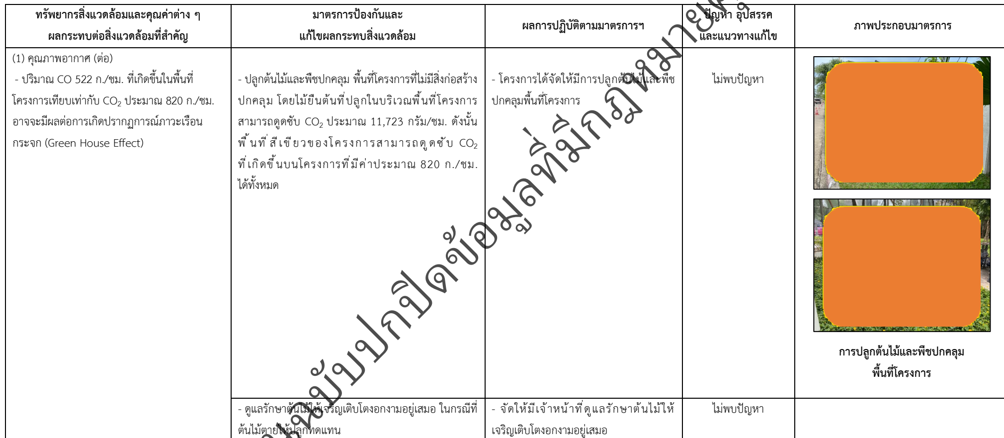
ตารางที่ 2-1 สรุปผลกระทบสิ่งแวดล้อมที่สำคัญและการปฏิบัติตามมาตรการป้องกันและแก้ไขผลกระทบสิ่งแวดล้อม มาตรการติดตามตรวจสอบผลกระทบสิ่งแวดล้อม โครงการโรงพยาบาลเกษมราษฎร์ รามคำแหง (ระยะดำเนินการ) (ต่อ)

โครงการ โรงพยาบาลเกษมราษฎร์ รามคำแหง (ระยะดำเนินการ) ของบริษัท บางกอกเจน ฮอสพิทอล จำกัด (มหาชน)