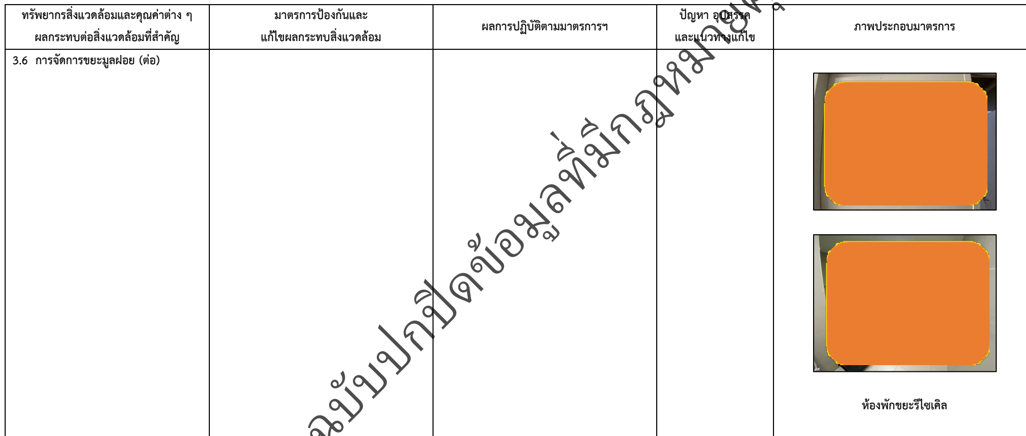
ตารางที่ 2-1 สรุปผลกระทบสิ่งแวดล้อมที่สำคัญและการปฏิบัติตามมาตรการป้องกันและแก้ไขผลกระทบสิ่งแวดล้อม มาตรการติดตามตรวจสอบผลกระทบสิ่งแวดล้อม โครงการโรงพยาบาลเกษมราษฎร์ งามคำแหง (ระยะดำเนินการ) (ต่อ)

โครงการ โรงพยาบาลเกษมราษฎร์ งามคำแหง (ระยะดำเนินการ) ของบริษัท บางกอกเจน ฮอสปิทอล จำกัด (มหาชน)