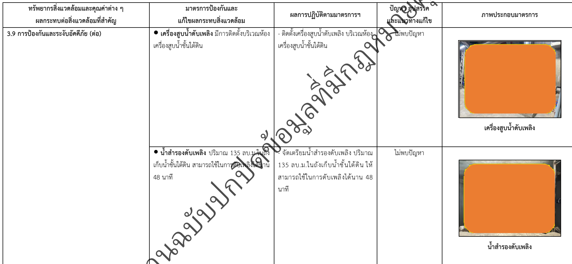
ตารางที่ 2-1 สรุปผลกระทบสิ่งแวดล้อมที่สำคัญและการปฏิบัติตามมาตรการป้องกันและแก้ไขผลกระทบสิ่งแวดล้อม มาตรการติดตามตรวจสอบผลกระทบสิ่งแวดล้อม โครงการโรงพยาบาลเกษมราษฎร์ รามคำแหง (ระยะดำเนินการ) (ต่อ)

โครงการ โรงพยาบาลเกษมราษฎร์ รามคำแหง (ระยะดำเนินการ) ของบริษัท บางกอกเจน ฮอสปิทอล จำกัด (มหาชน)