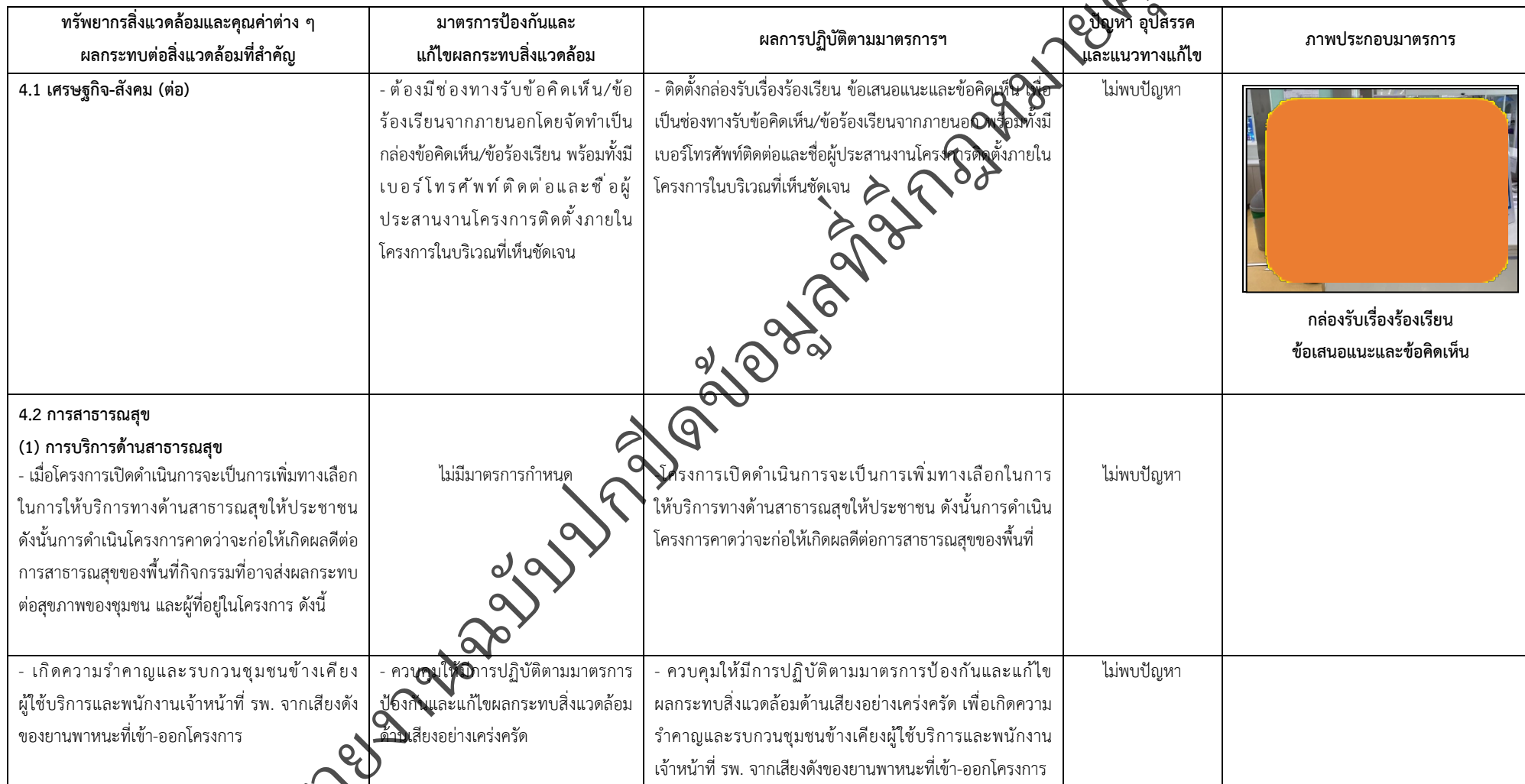
ตารางที่ 2-1 สรุปผลกระทบสิ่งแวดล้อมที่สำคัญและการปฏิบัติตามมาตรการป้องกันและแก้ไขผลกระทบสิ่งแวดล้อม มาตรการติดตามตรวจสอบผลกระทบสิ่งแวดล้อม โครงการโรงพยาบาลเกษมราษฎร์ รามคำแหง (ระยะดำเนินการ) (ต่อ)

โครงการ โรงพยาบาลเกษมราษฎร์ รามคำแหง (ระยะดำเนินการ) ของบริษัท บางกอกเจน ฮอสปิทอล จำกัด (มหาชน)