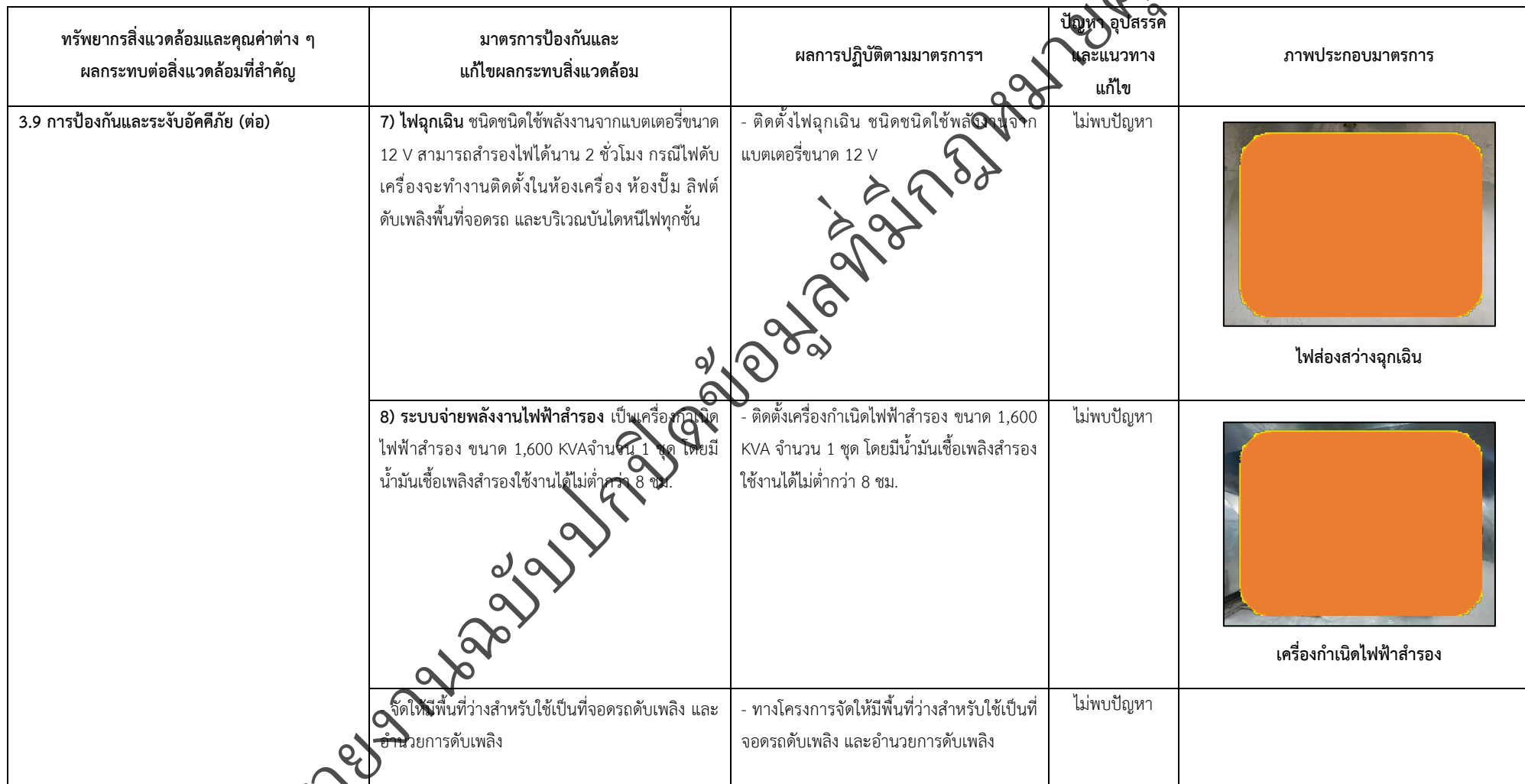
ตารางที่ 2-1 สรุปผลกระทบสิ่งแวดล้อมที่สำคัญและการปฏิบัติตามมาตรการป้องกันและแก้ไขผลกระทบสิ่งแวดล้อม มาตรการติดตามตรวจสอบผลกระทบสิ่งแวดล้อม โครงการโรงพยาบาลเกษมราษฎร์ รามคำแหง (ระยะดำเนินการ) (ต่อ)

โครงการ โรงพยาบาลเกษมราษฎร์ รามคำแหง (ระยะดำเนินการ) ของบริษัท บางกอกเจน ฮอสปิทอล จำกัด (มหาชน)