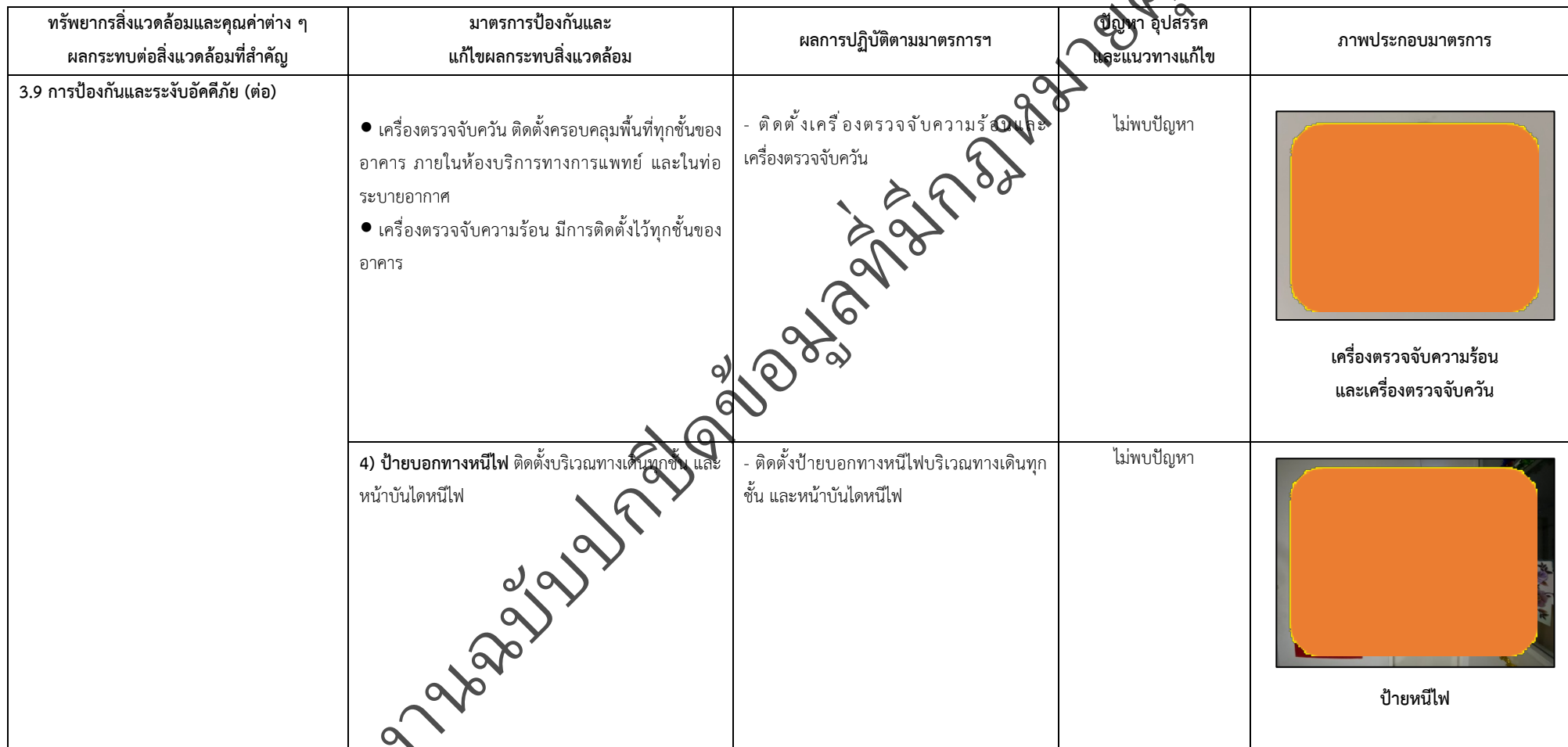
ตารางที่ 2-1 สรุปผลกระทบสิ่งแวดล้อมที่สำคัญและการปฏิบัติตามมาตรการป้องกันและแก้ไขผลกระทบสิ่งแวดล้อม มาตรการติดตามตรวจสอบผลกระทบสิ่งแวดล้อม โครงการโรงพยาบาลเกษมราษฎร์ रामคำแหง (ระยะดำเนินการ) (ต่อ)

โครงการ โรงพยาบาลเกษมราษฎร์ रामคำแหง (ระยะดำเนินการ) ของบริษัท บางกอกเจน ฮอสปิทอล จำกัด (มหาชน)