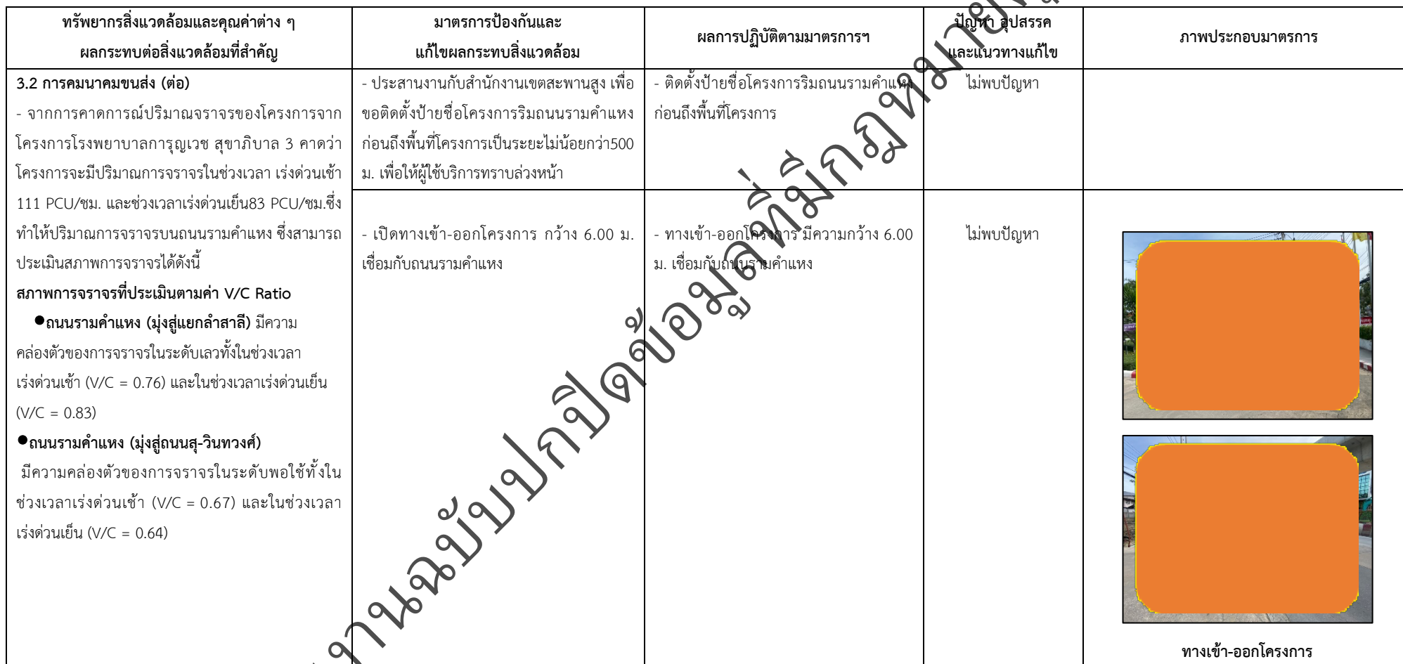
ตารางที่ 2-1 สรุปผลกระทบสิ่งแวดล้อมที่สำคัญและการปฏิบัติตามมาตรการป้องกันและแก้ไขผลกระทบสิ่งแวดล้อม มาตรการติดตามตรวจสอบผลกระทบสิ่งแวดล้อม โครงการโรงพยาบาลเกษมราษฎร์ รามคำแหง (ระยะดำเนินการ) (ต่อ)

โครงการ โรงพยาบาลเกษมราษฎร์ รามคำแหง (ระยะดำเนินการ) ของบริษัท บางกอกเจน ฮอสปิทอล จำกัด (มหาชน)