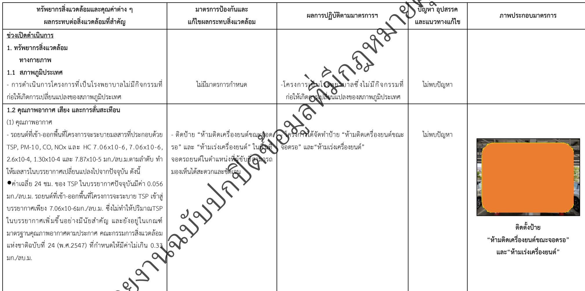
ตารางที่ 2-1 สรุปผลกระทบสิ่งแวดล้อมที่สำคัญและการปฏิบัติตามมาตรการป้องกันและแก้ไขผลกระทบสิ่งแวดล้อม มาตรการติดตามตรวจสอบผลกระทบสิ่งแวดล้อม โครงการโรงพยาบาลเกษมราษฎร์ रामคำแหง (ระยะดำเนินการ)

โครงการ โรงพยาบาลเกษมราษฎร์ रामคำแหง (ระยะดำเนินการ) ของบริษัท บางกอกเจน ฮอสปิทอล จำกัด (มหาชน)