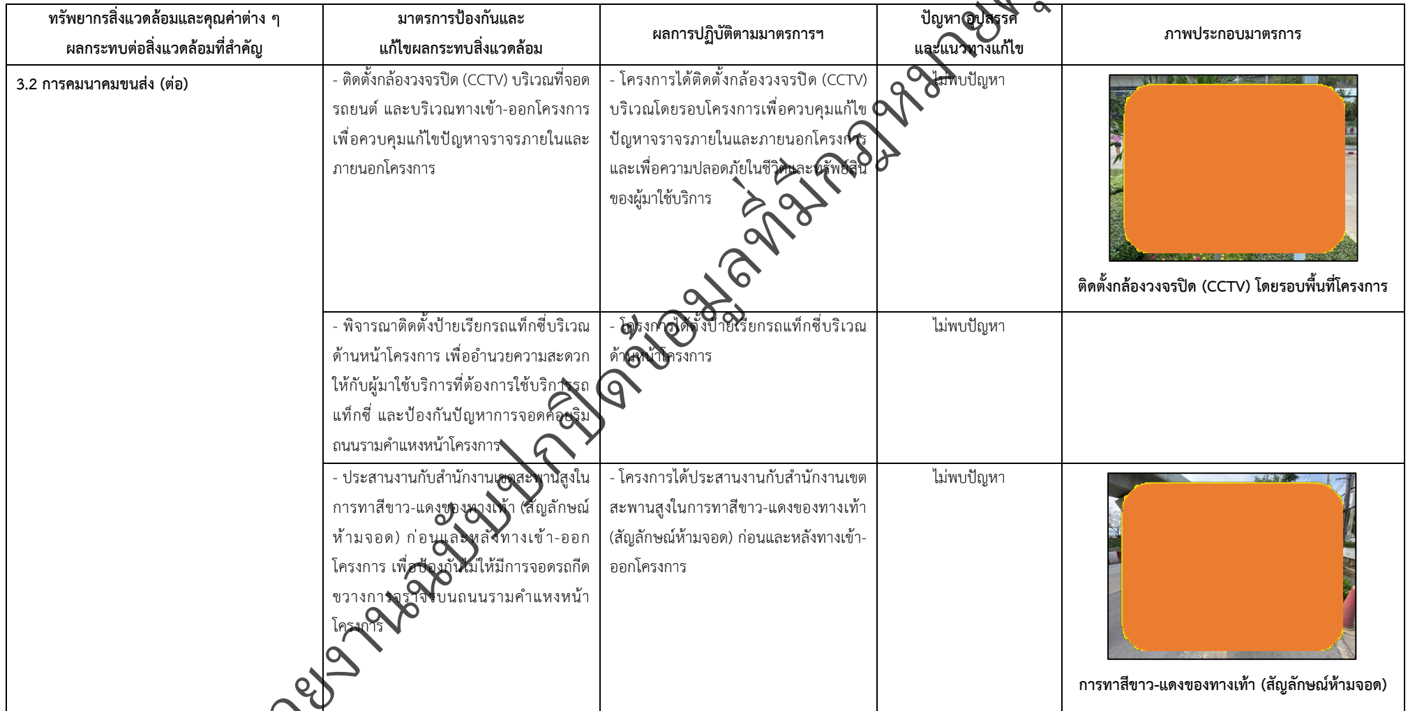
ตารางที่ 2-1 สรุปผลกระทบสิ่งแวดล้อมที่สำคัญและการปฏิบัติตามมาตรการป้องกันและแก้ไขผลกระทบสิ่งแวดล้อม มาตรการติดตามตรวจสอบผลกระทบสิ่งแวดล้อม โครงการโรงพยาบาลเกษมราษฎร์ รามคำแหง (ระยะดำเนินการ) (ต่อ)

โครงการ โรงพยาบาลเกษมราษฎร์ รามคำแหง (ระยะดำเนินการ) ของบริษัท บางกอกเจน ฮอสปิทอล จำกัด (มหาชน)