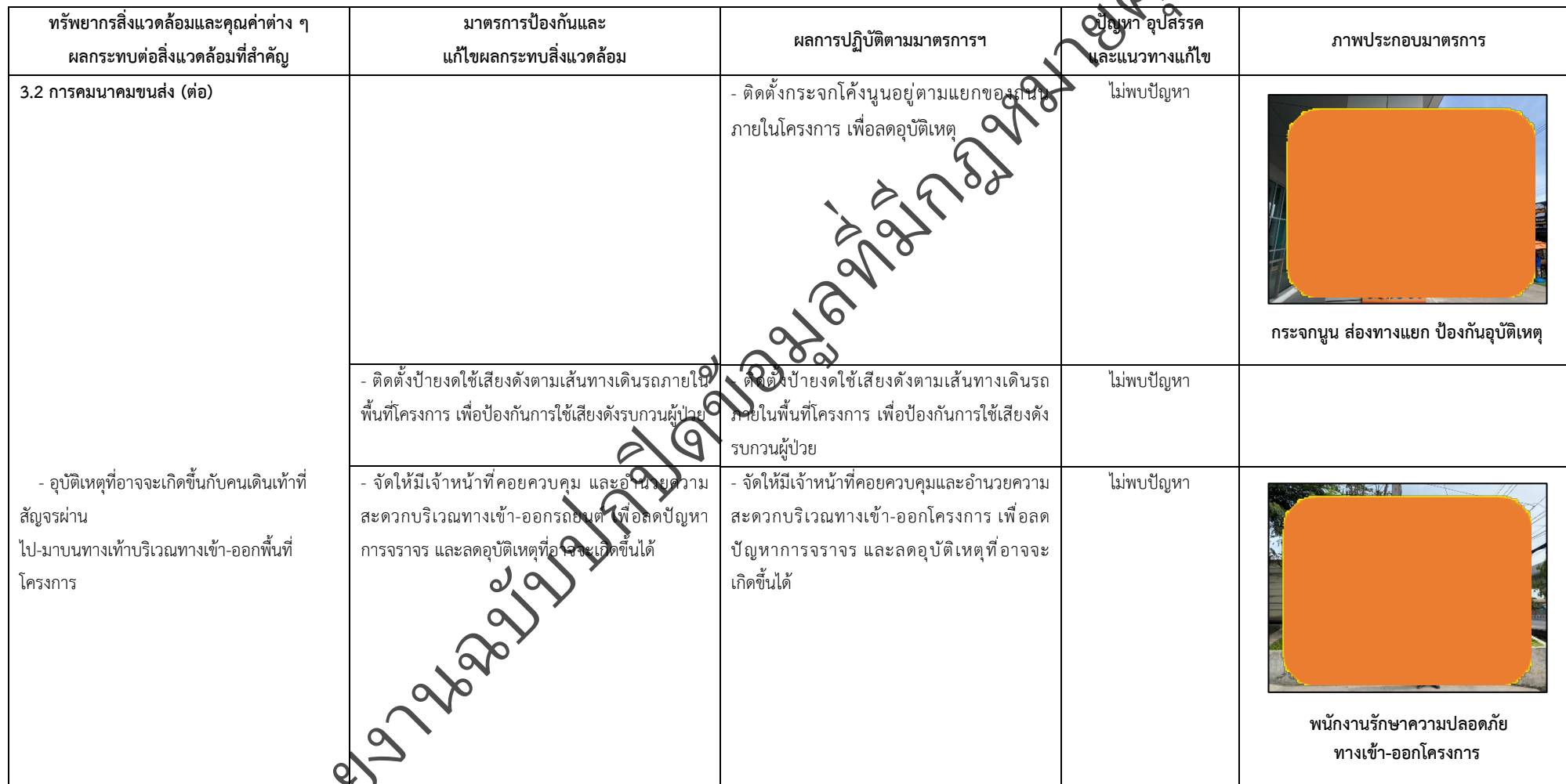
ตารางที่ 2-1 สรุปผลกระทบสิ่งแวดล้อมที่สำคัญและการปฏิบัติตามมาตรการป้องกันและแก้ไขผลกระทบสิ่งแวดล้อม มาตรการติดตามตรวจสอบผลกระทบสิ่งแวดล้อม โครงการโรงพยาบาลเกษมราษฎร์ รามคำแหง (ระยะดำเนินการ) (ต่อ)

โครงการ โรงพยาบาลเกษมราษฎร์ รามคำแหง (ระยะดำเนินการ) ของบริษัท บางกอกเจน ฮอสปิทอล จำกัด (มหาชน)