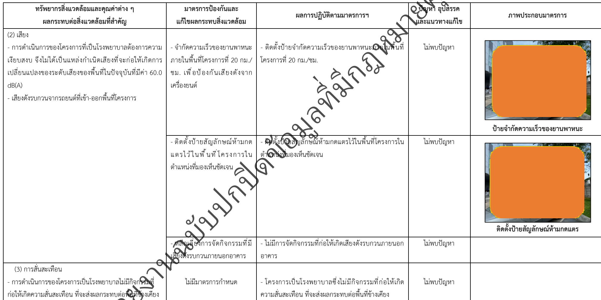
ตารางที่ 2-1 สรุปผลกระทบสิ่งแวดล้อมที่สำคัญและการปฏิบัติตามมาตรการป้องกันและแก้ไขผลกระทบสิ่งแวดล้อม มาตรการติดตามตรวจสอบผลกระทบสิ่งแวดล้อม โครงการโรงพยาบาลเกษมราษฎร์ งามคำแหง (ระยะดำเนินการ) (ต่อ)

โครงการ โรงพยาบาลเกษมราษฎร์ งามคำแหง (ระยะดำเนินการ) ของบริษัท บางกอกเจน ฮอสปิทอล จำกัด (มหาชน)