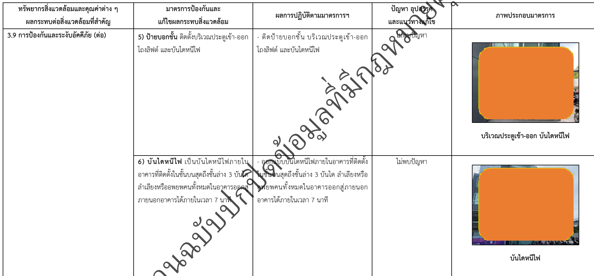
ตารางที่ 2-1 สรุปผลกระทบสิ่งแวดล้อมที่สำคัญและการปฏิบัติตามมาตรการป้องกันและแก้ไขผลกระทบสิ่งแวดล้อม มาตรการติดตามตรวจสอบผลกระทบสิ่งแวดล้อม โครงการโรงพยาบาลเกษมราษฎร์ รามคำแหง (ระยะดำเนินการ) (ต่อ)

โครงการ โรงพยาบาลเกษมราษฎร์ รามคำแหง (ระยะดำเนินการ) ของบริษัท บางกอกเจน ฮอสปิทอล จำกัด (มหาชน)