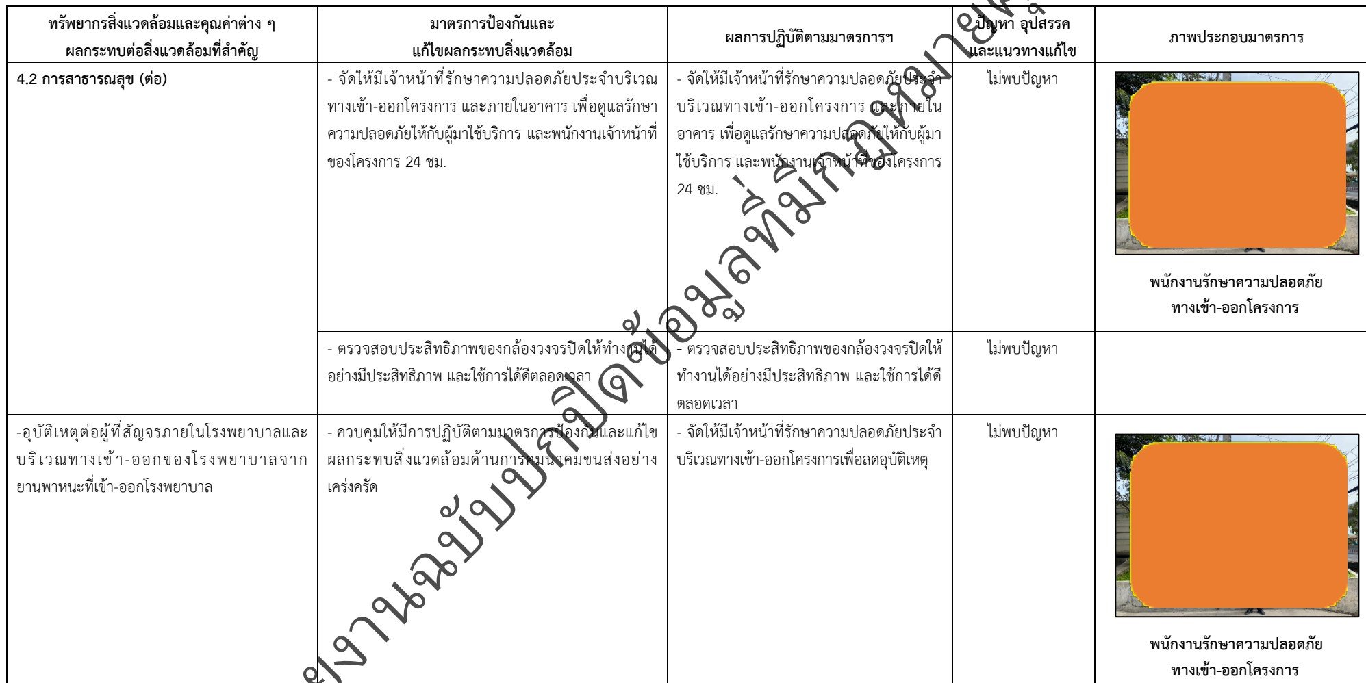
ตารางที่ 2-1 สรุปผลกระทบสิ่งแวดล้อมที่สำคัญและการปฏิบัติตามมาตรการป้องกันและแก้ไขผลกระทบสิ่งแวดล้อม มาตรการติดตามตรวจสอบผลกระทบสิ่งแวดล้อม โครงการโรงพยาบาลเกษมราษฎร์ รามคำแหง (ระยะดำเนินการ) (ต่อ)

โครงการ โรงพยาบาลเกษมราษฎร์ รามคำแหง (ระยะดำเนินการ) ของบริษัท บางกอกเจน ฮอสปิทอล จำกัด (มหาชน)