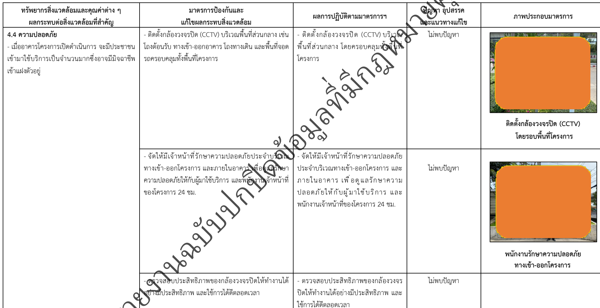
ตารางที่ 2-1 สรุปผลกระทบสิ่งแวดล้อมที่สำคัญและการปฏิบัติตามมาตรการป้องกันและแก้ไขผลกระทบสิ่งแวดล้อม มาตรการติดตามตรวจสอบผลกระทบสิ่งแวดล้อม โครงการโรงพยาบาลเกษมราษฎร์ รามคำแหง (ระยะดำเนินการ) (ต่อ)

โครงการ โรงพยาบาลเกษมราษฎร์ รามคำแหง (ระยะดำเนินการ) ของบริษัท บางกอกเจน ฮอสปิทอล จำกัด (มหาชน)