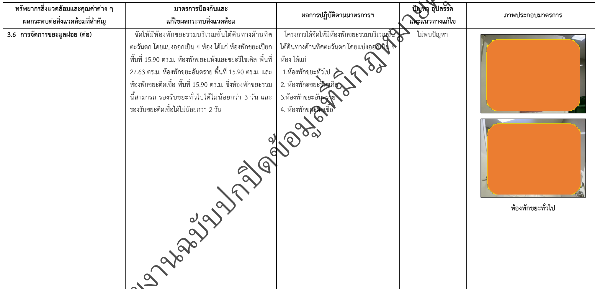
ตารางที่ 2-1 สรุปผลกระทบสิ่งแวดล้อมที่สำคัญและการปฏิบัติตามมาตรการป้องกันและแก้ไขผลกระทบสิ่งแวดล้อม มาตรการติดตามตรวจสอบผลกระทบสิ่งแวดล้อม โครงการโรงพยาบาลเกษมราษฎร์ งามคำแหง (ระยะดำเนินการ) (ต่อ)

โครงการ โรงพยาบาลเกษมราษฎร์ งามคำแหง (ระยะดำเนินการ) ของบริษัท บางกอกเจน ฮอสปิทอล จำกัด (มหาชน)