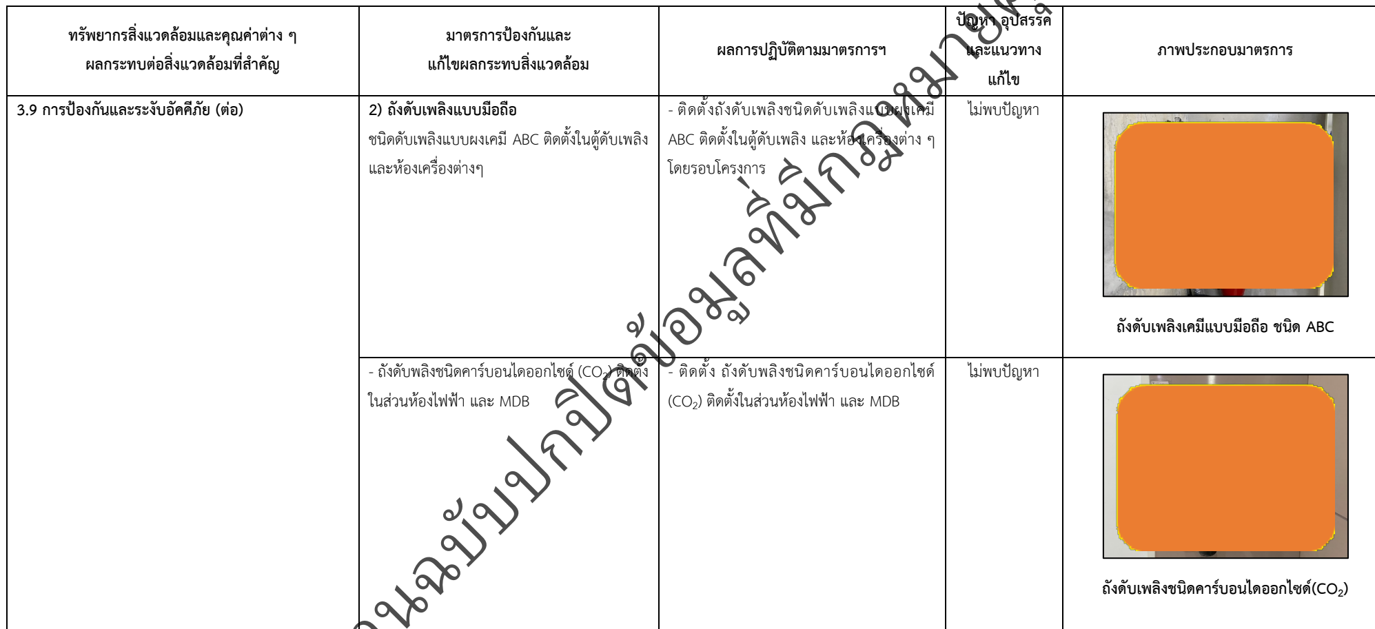
ตารางที่ 2-1 สรุปผลกระทบสิ่งแวดล้อมที่สำคัญและการปฏิบัติตามมาตรการป้องกันและแก้ไขผลกระทบสิ่งแวดล้อม มาตรการติดตามตรวจสอบผลกระทบสิ่งแวดล้อม โครงการโรงพยาบาลเกษมราษฎร์ รามคำแหง (ระยะดำเนินการ) (ต่อ)

โครงการ โรงพยาบาลเกษมราษฎร์ รามคำแหง (ระยะดำเนินการ) ของบริษัท บางกอกเจน ฮอสปิทอล จำกัด (มหาชน)