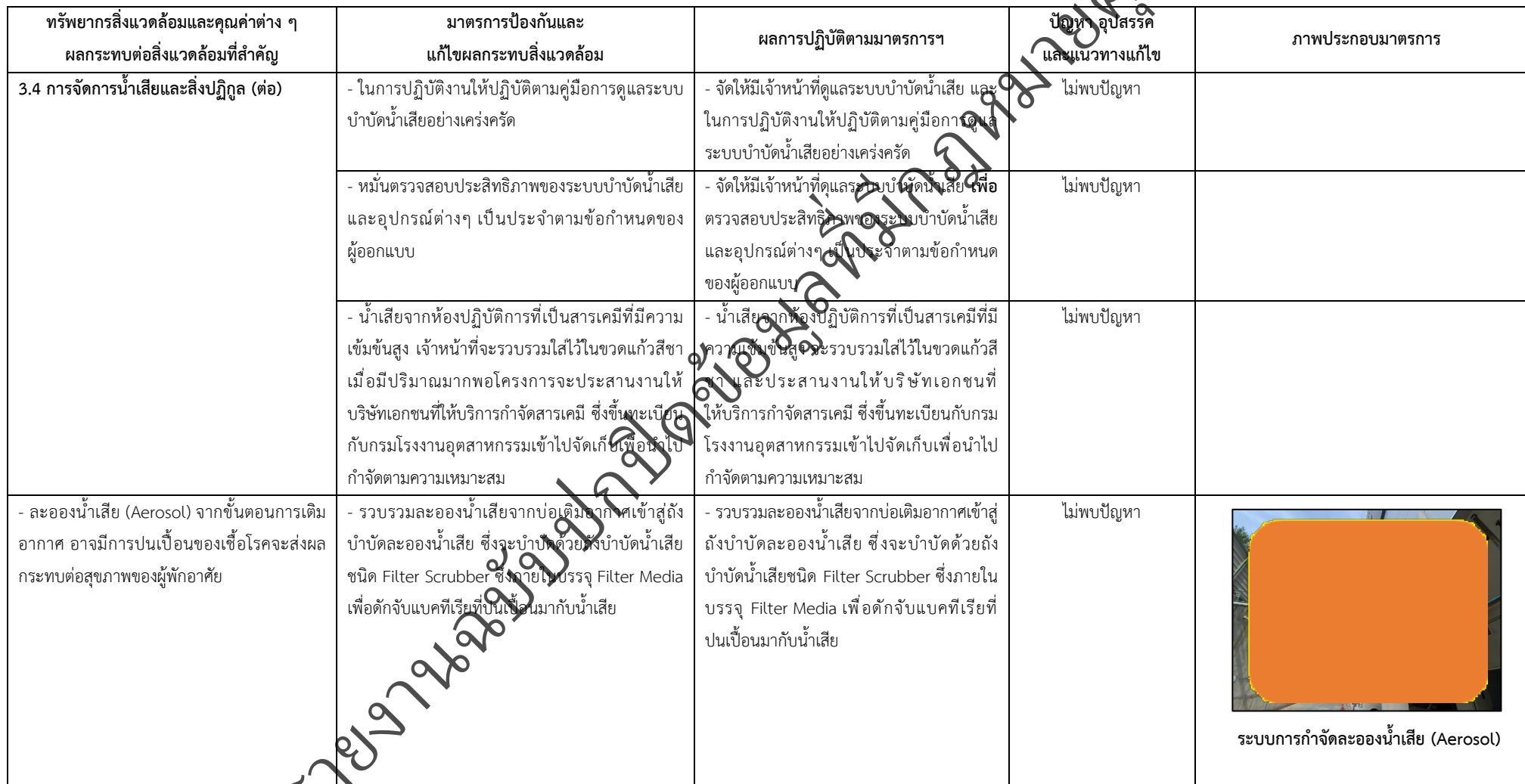
ตารางที่ 2-1 สรุปผลกระทบสิ่งแวดล้อมที่สำคัญและการปฏิบัติตามมาตรการป้องกันและแก้ไขผลกระทบสิ่งแวดล้อม มาตรการติดตามตรวจสอบผลกระทบสิ่งแวดล้อม โครงการโรงพยาบาลเกษมราษฎร์ รามคำแหง (ระยะดำเนินการ) (ต่อ)

โครงการ โรงพยาบาลเกษมราษฎร์ รามคำแหง (ระยะดำเนินการ) ของบริษัท บางกอกเจน ฮอสพิทอล จำกัด (มหาชน)